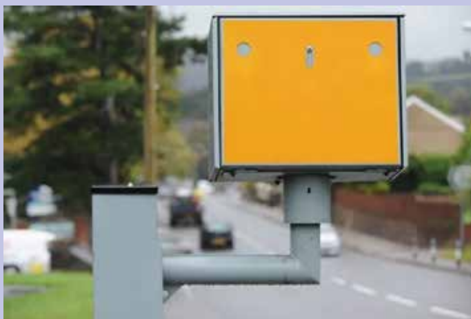
Scatola contenitore di autovelox fisso