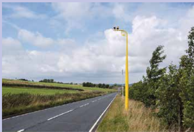
Punto di misurazione della velocità media